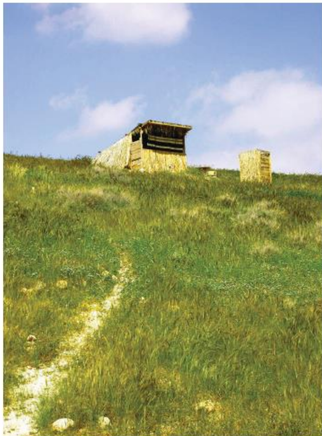
"סוויטה" בחאן ארץ המרדפים - חניון לילה מדברי, אקולוגי ורומנטי

" יואל מעשנת בשרים - א.ת. כפר אדומים, זה המקום לאכול טוב. ביסטרו ומינדניית בוטיק לבשרים מעושנים, נקניקים, סלטים טעימים וקינוחים נהדרים, במבנה מרווח ומאורז, בניהול השף יואל בן שבת. טל': 02-9974274.