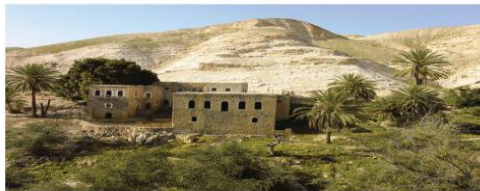
בליבה של ארץ התנך משתרע חבל בנימין. מדבר דרמטי ומעינות שופעים, הרים כושאים ומישורים ירוקים, חלוציות בתי-זמננו וחוויות בלתי נשכחות למטיילים. והמצלמה חוגגת. כתבה וצילמה שוש ליהב