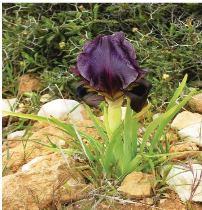
אירוס הגלבווע פורה במלוא תפארתו בכיפת הכוכב

במה חשקה נפשכם? בארץ התנ"ך, בדרך המעינות, בדרך היין והיקבים, בדרך הזית ובתי הבר, בדרכי האוכל והארוח, בשבילי האומנויות, באתרים ארכיאולוגיים, בשמורות טבע ודרכי נוף (ברוד, איזה צלם אינו מחפש אובייקטים לצילום)? האם תרצו להתנייד ברגל, באופניים, בג'יפים, בטרקטורונים, על סוסים ובכנ, ההיעני רחב ומגוון, יוננה על כל טינם ובחירה.