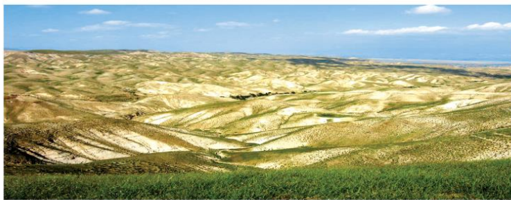
נוף קדומים. תצפית טריהיבה על ואדי קלט (סווי בימים יום "כנען תיירות")